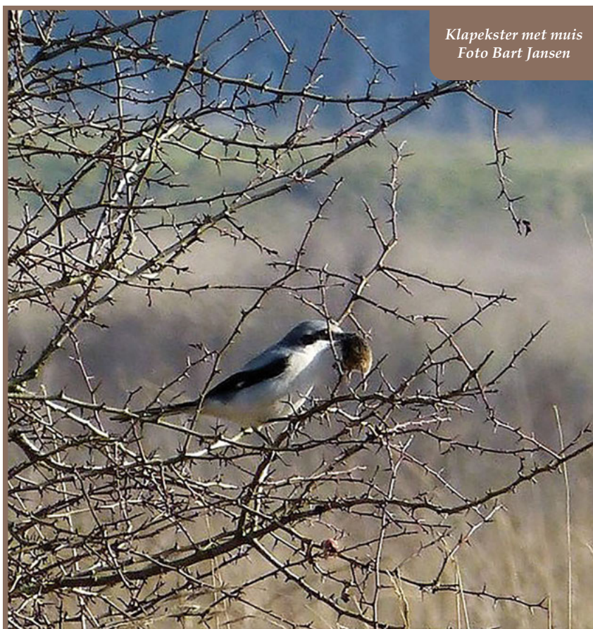
Klapekster met muis

Als vogelaar heb je een soort antenne voor vogels die je hoort en ziet als je buiten bent. Meestal hoor je ze eerst en herken je vrijwel altijd de vogel aan zijn geluid. Dat kan de mooie melodie van een zwartkop zijn, de schreeuw van een lawaaierige gaai of het