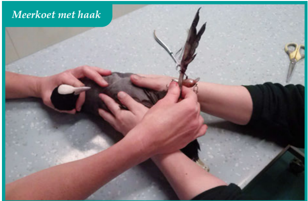
Meerkoet met haak

We zijn altijd blij dat we gebeld worden en kunnen helpen. Wij proberen de vogels ter plaatse te helpen en zo nodig nemen we ze mee en brengen ze naar een dierenarts, of de vogelopvang waar ze hopelijk verder kunnen herstellen. Laat men het begaan, dan zit het slachtoffer gevangen, kan niet meer vrijuit bewegen of loopt mogelijk ontstekingen op, kan niet meer eten, tot tenslotte de dood erop volgt.