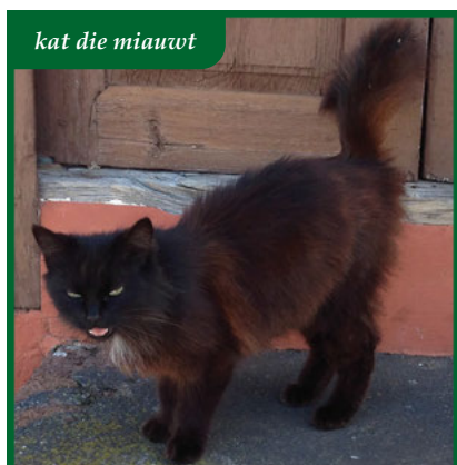
kat die miauwt

Katten miauwen alleen tegen mensen. Een kat heeft razendsnel door dat miauwen een goede manier is om aandacht te krijgen. Hij miauwt omdat wij erop reageren bijvoorbeeld door terug te praten of de kat iets lekkers te geven. Het is aangeleerd gedrag. Sommige katten zijn buitengewoon spraakzaam en miauwen de hele dag door, andere beperken zich tot geluidloos het bekje open en dicht doen.